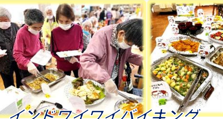
インドワイワイバイキング