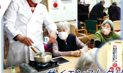
サイエンスレクリエーション/手作り豆腐作り