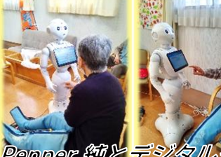
Pepper 純とデジタル交流