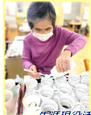
生涯現役活動 いつもありがとうございます!!

食に彩りとワクワク感を♪ 17日(水) 第3回食彩謝恩バイキング 23日(火) 春のキッチンカーイベント