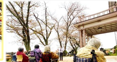
お花見散策/屋外機能訓練