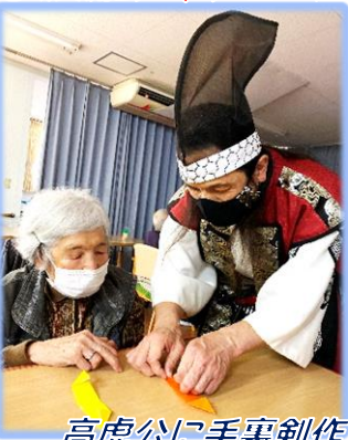
高虎公に手裏剣作りを習う