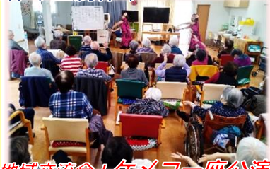
地域交流会!ケメコ一座公演 百人一首