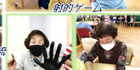
手形鯉のぼり制作