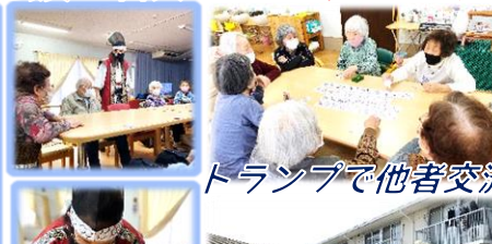
トランプで他者交流